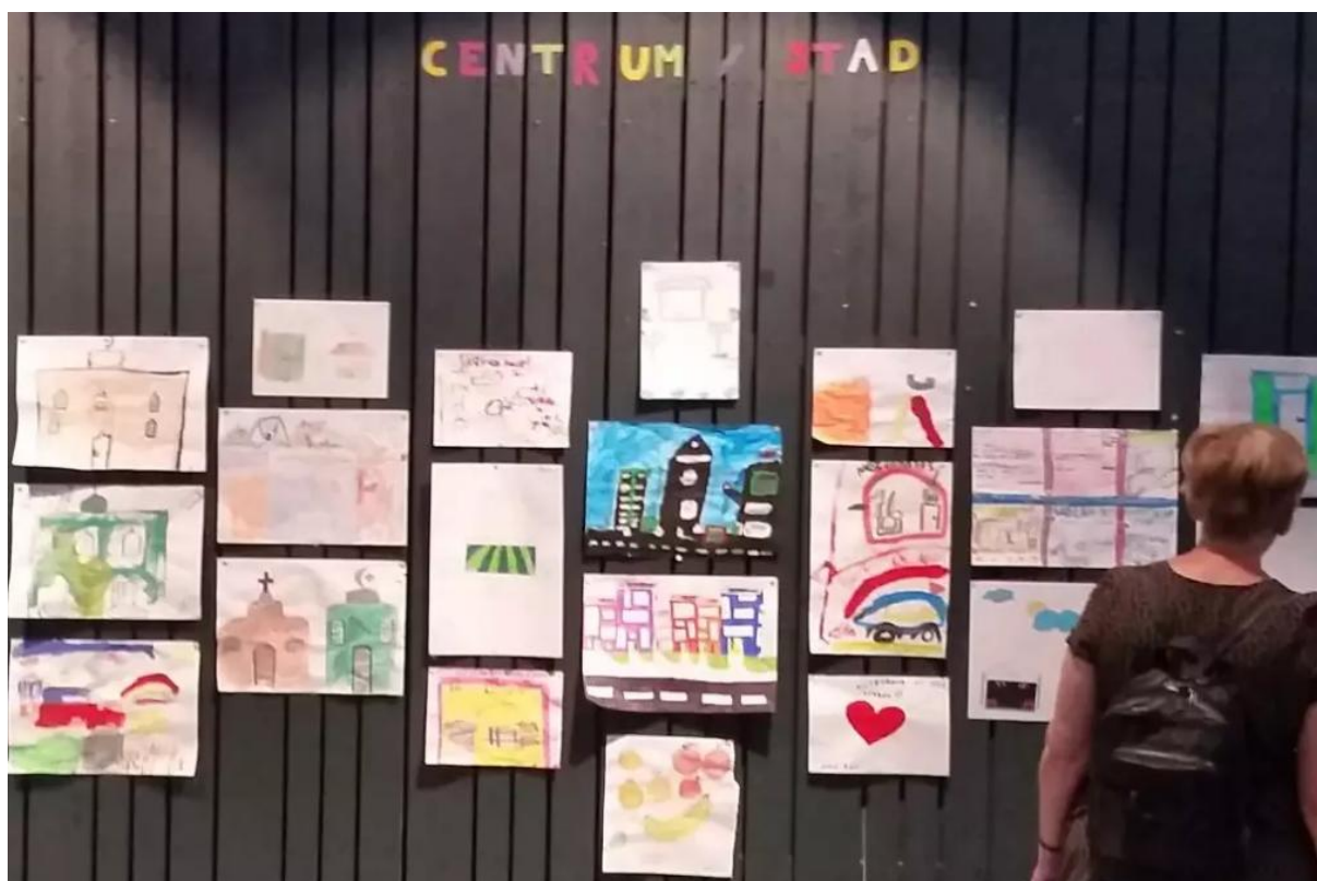
Figur 5. Barns tankar om framtiden

På vårvintern 2022 kommer nästa stora flyktingvåg efter den ryska invasionen av Ukraina. Många söker sig till Uppsala, en del har släktingar och vänner att bo hos, en del inkvarteras i en förläggning i Kronparken. Kommunens krisgrupp där vi ingår aktiveras och ett flyktingnätverk bildas som består av kommunen, länsstyrelsen och de ideella organisationer som arbetar för flyktingarna. Vi deltar i engagemangsmässan för studenter i Blåsenhus och får många volontärer som vill arbeta med aktiviteter för de ukrainska barnen. Ett tiotal volontärer sedan engagerade i aktiviteter i Kronparken två gånger i veckan. Där har IKEA ställt i ordning ett lekrum för de små barnen.