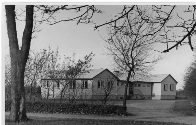
Figur 1 Barnhemmet i Husum, Schleswig

Material och inredning samlas in av Rädda Barnen i Uppsala län och när husen är färdiga för invigning 1952 finns allt på plats, t.o.m. tavlor av tomtebobarnen och uppsalafotografier av Gunnar Sundqvist på väggarna, men det är bekymmer för barnhemsledningen att skaffa pengar till ett lagat mål mat om dagen till barnen.