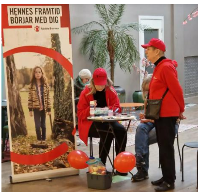
Figur 8. Vi syns i S:t Persgallerian