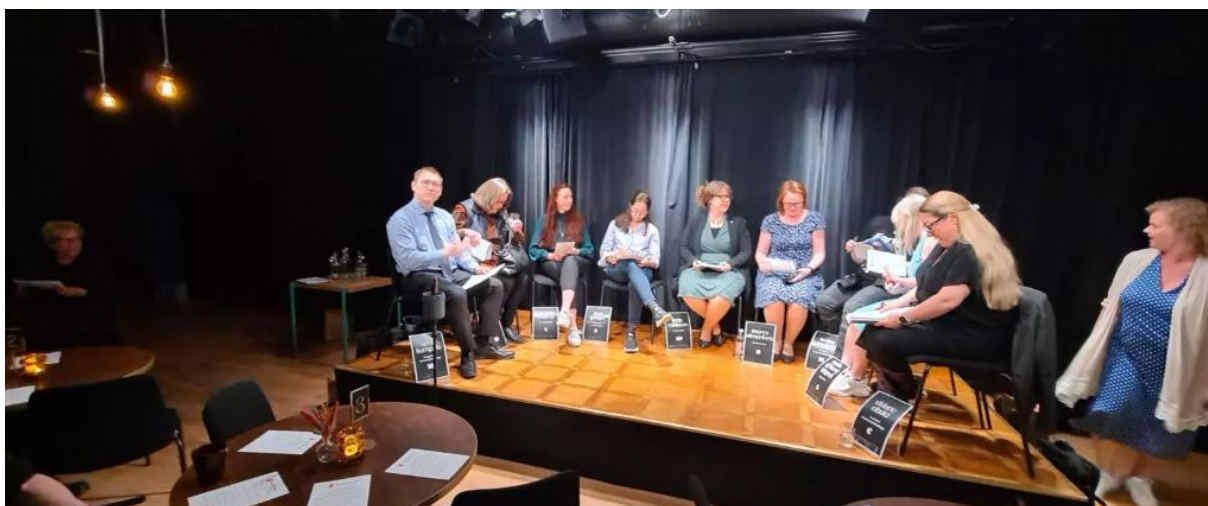
Figur 7. Politikermöte 2023