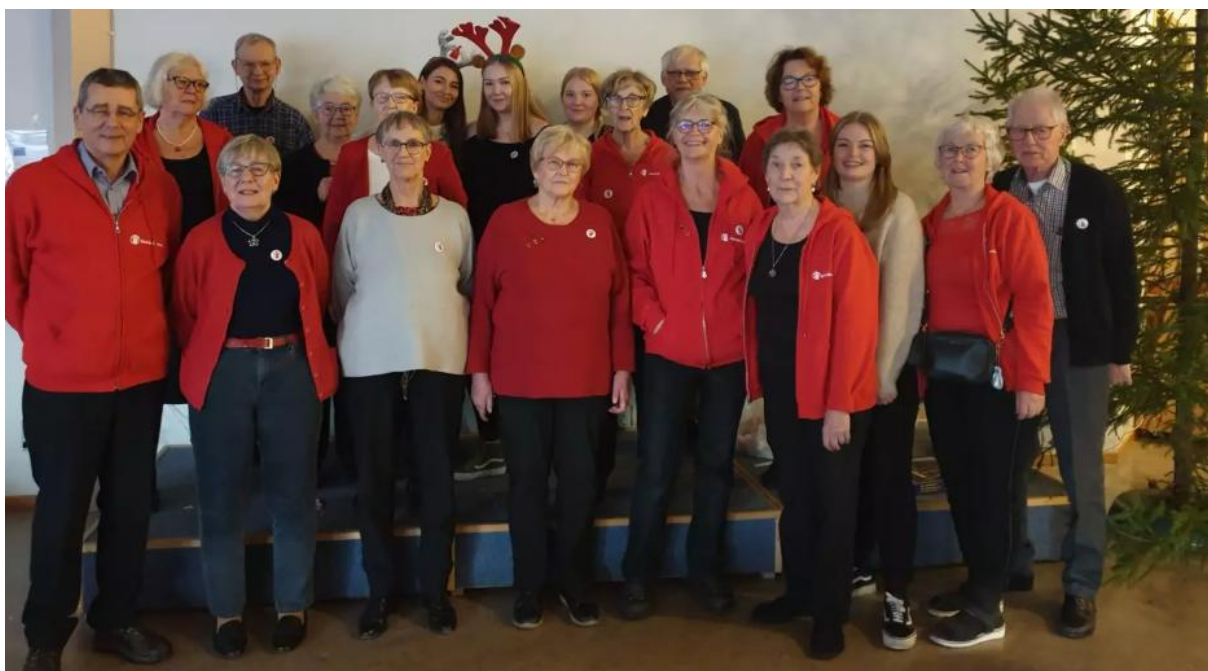
Figur 4. Julmarknad 2019

Julmarknaden ställdes in 2020 men inte 2021. Capricen ställdes in både 2020 och 2021, medförde avbräck i vår pengainsamling.