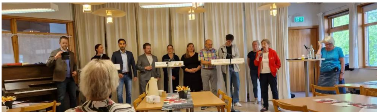
Figur 6. Möte med politiker 2022

2022 är det åter valår. Vi ordnar ett möte med samtliga partier på Stadsteatern med temat Barns situation i Uppsala.